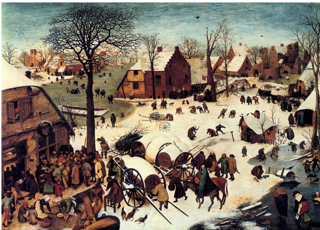
Id. Pieter Bruegel: Betlehemi népszámlálás (1566)

Remeteszőlős Község Önkormányzatának tájékoztató lapja