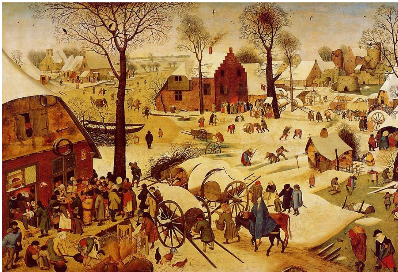
Pieter Bruegel: Betlehemi népszámlálás